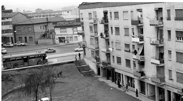
A l'esquerra, Plaça de Gràcia a l'any 1985. A la dreta, Plaça de Sant Antoni. Any 1974.