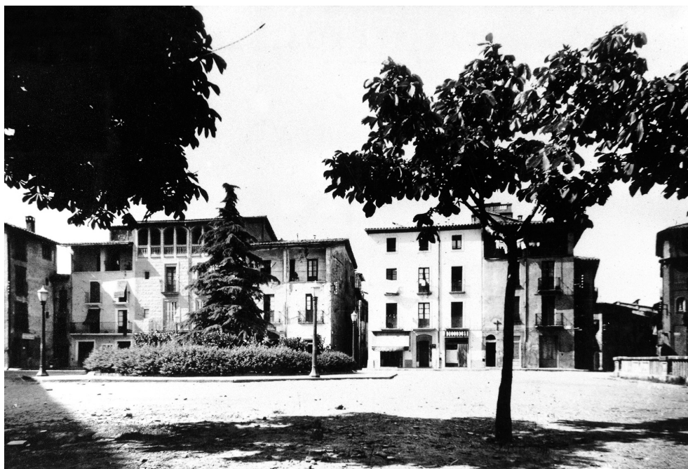
Plaça de Dalt Vila. Any 1951. Biblioteca Municipal de Manlleu BBVA.

ment el pas del temps, tot i que l'ambient calmat que s'hi respira les situa fora del present accelerat que vivim.