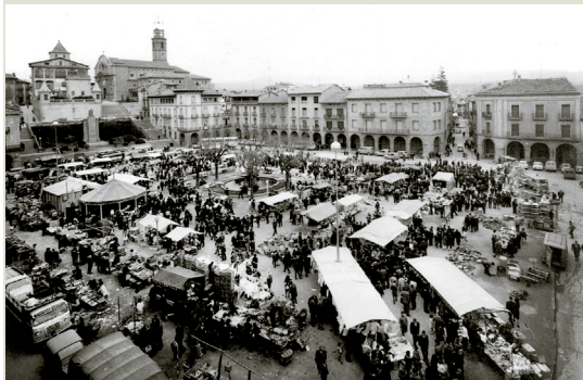
Darrer mercat a la plaça Fra Bernadí abans de la seva remodelació de l'any 1967.

A Manlleu, des del segle XVIII, el mercat setmanal del dilluns sempre va tenir una presència important a les places. Amb la construcció de la plaça Fra Bernadí s'hi traslladà el mercat que tenia lloc a Dalt Vila. En un principi, les parades col·locaven els seus productes al terra de la plaça. D'aquest fet en va sortir l'expressió d'anar a comprar a "terraplaça". Amb els anys, el mercat va créixer significativament, amb la presència de parades de tota classe (comestibles, verdures, roba, calçat, etc) i també amb parades de venda de bestiar. Al mercat, hi acudien pagesos i botiguers d'arreu de la comarca, avesats als negocis i al tracte oral.