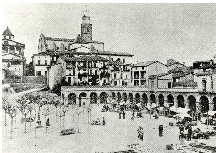
Mercat a la plaça Fra Bernadí a principis del segle XX. Biblioteca Municipal de Manlleu BBVA.

Baixo de la plaça de Dalt Vila per les escales de la font de la Mare de Déu. Abans, però, contemplo la vista privilegiada de la plaça Fra Bernadí des de la seva talaia natural. Des d'aquest punt precís, es pot entendre com Manlleu explica la seva història des de mitjan segle XIX fins a principis del XX, amb la diferència entre el Dalt i el Baix Vila. Per davant, s'obre la vista de la ciutat que s'eixampla en direcció al riu, mentre que al darrere s'hi alça l'antiga sagrera de Manlleu. Segueixo baixant per les escales de la plaça Fra Bernadí, construïdes damunt del desnivell que antigament es coneixia amb el nom dels rampants. Aquesta geografia pronunciada fa que hom tingui la sensació que la ciutat d'origen medieval observi sempre des de l'alçada i amatent el que un dia va ser la nova ciutat industrial.