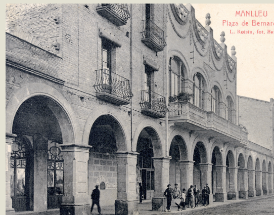
Façana del teatre cinema Edison a l'any 1930.

A banda d'aquests edificis emblemàtics, la plaça també va omplir-se de botigues i bars que anirien canviant segons l'època. Els primers bars de la plaça —el cafè de la Cooperativa, el cafè de l'Edison, el bar Esport i la Fonda Catalunya— van ser bàsics per estendre aquesta nova sociabilitat urbana. Posteriorment, s'hi sumarien bars tan populars com el bar Amadeu o el bar Parramon, veritables centres instituïts socialment. Pel que fa a les botigues es comptaven