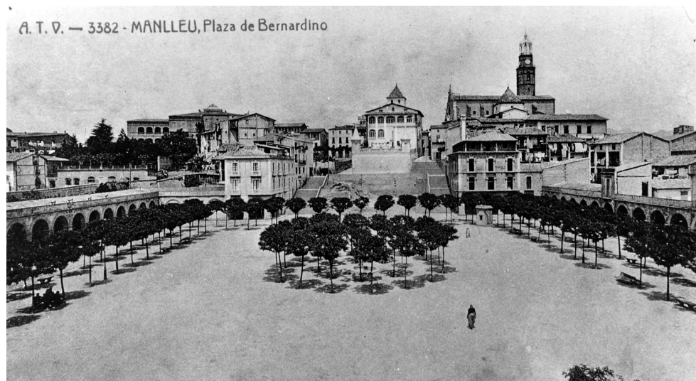
Targeta fotogràfica de la plaça Fra Bernadí a principis del segle XX. Autor: Àngel Toldrà Viazo. Biblioteca Municipal de Manlleu BBVA.

es van estendre les places porxades vuitcentistes que mostraven la renovació urbanística del país amb la construcció de places de gran extensió, amb el predomini de la funcionalitat i de l'ordenació de l'espai. Aquest va ser l'emblema de la ciutat moderna que apareixia com un espai transitable, ja sigui pels primers automòbils i també per acollir-hi l'activitat comercial en creixement. A Manlleu, els terrenys de la plaça Nova es van construir sobre les terres conegudes com els horts del rector. Un clar exemple de com els espais vinculats al conreu es transformaven en espais urbans. Amb aquesta construcció, la ciutat prenia una nova imatge, fent